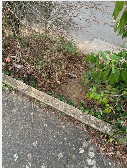
Passage des élèves dans le talus