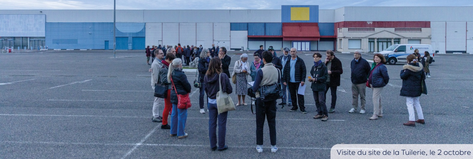
Visite du site de la Tuilerie, le 2 octobre